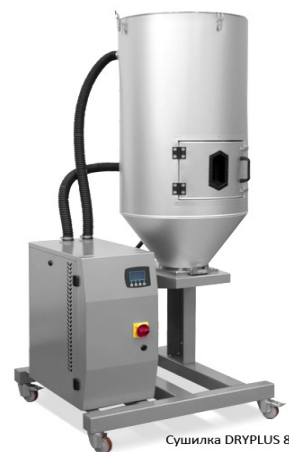
Сушилка DRYPLUS 80

Серия Dryplus - стандартные сушилки для широкого спектра задач.